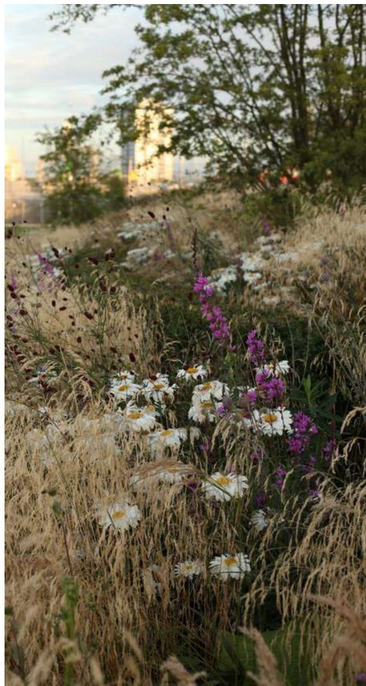
OSÁZENÉ OSTRŮVKY POD DOMEM