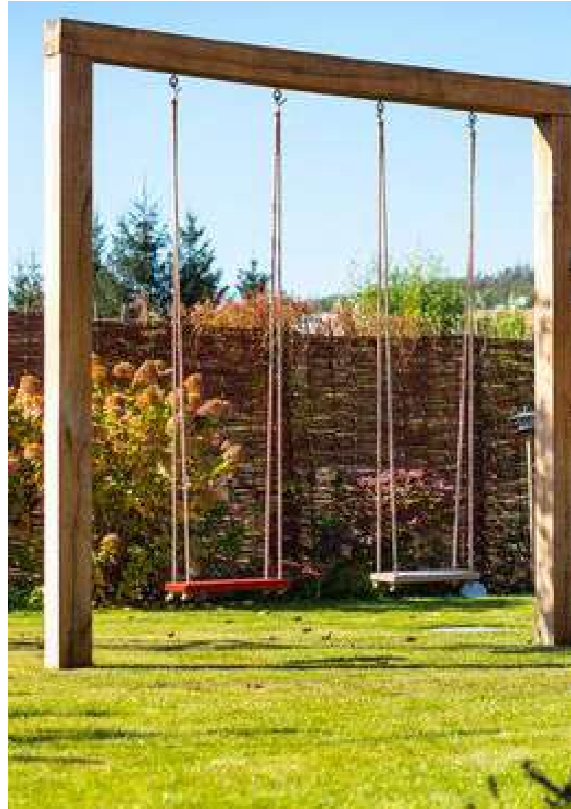
HOUPAČKY PRO DĚTI I DOPĚLÉ